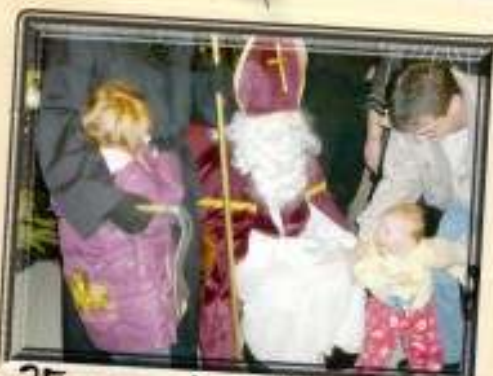
Le 25 novembre, Saint Nicolas