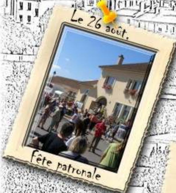
Le 26 août,