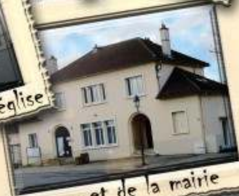
... et de la mairie