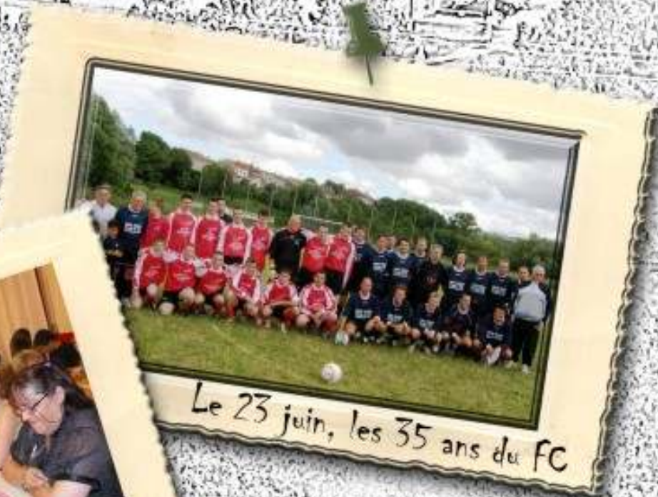
Le 23 juin, les 35 ans du FC