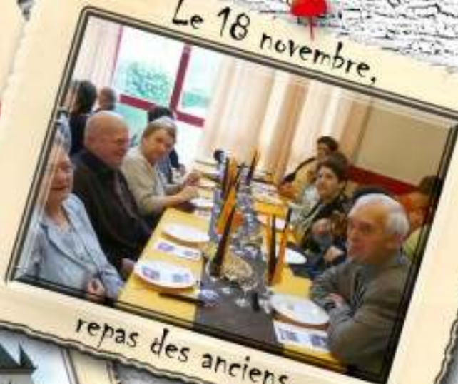
repas des anciens