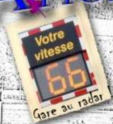
Gare au radar