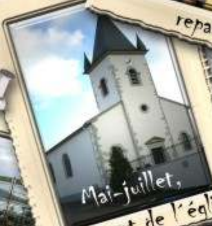
Mai-juillet, travalement de l'église