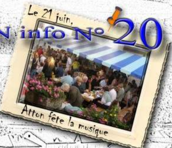
Le 21 juin,