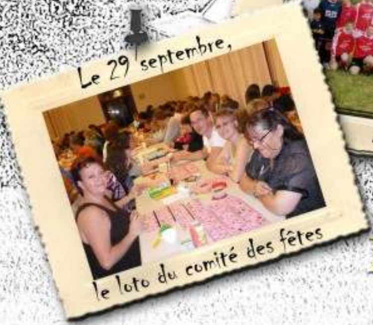
Le 29 septembre,