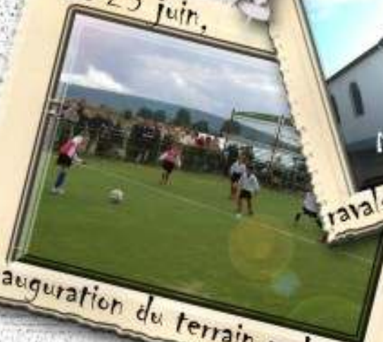
inauguration du terrain multisport