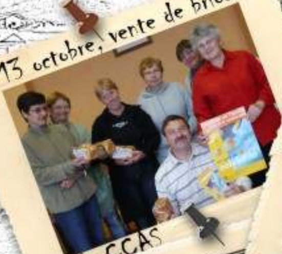
par le CCAS