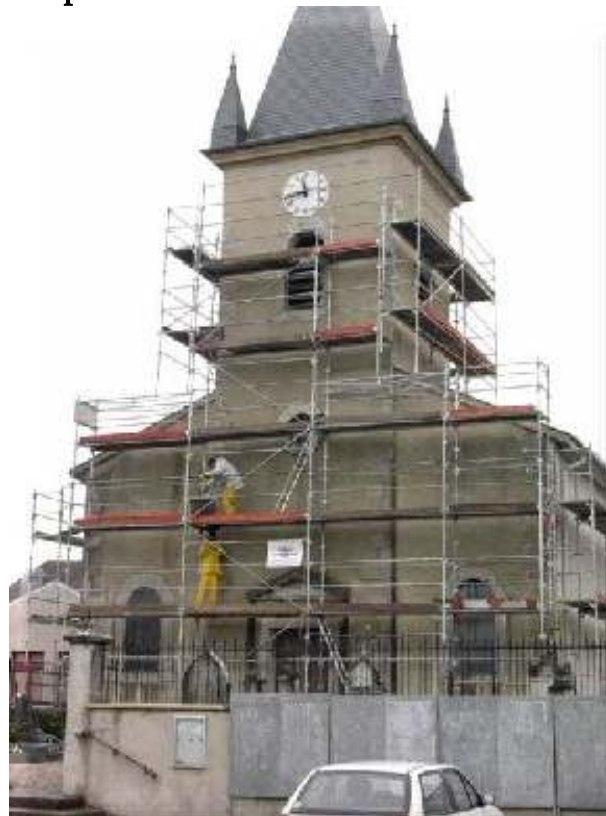
Travaux sur l'église :

une cure de jouvence pour l'église d'Atton